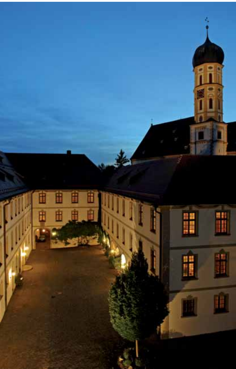
Bayerische Musikakademie Marktoberdorf Innenhof mit Stadtpfarrkirche St. Martin